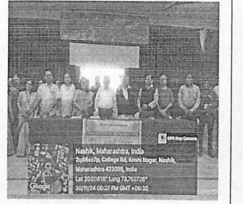
परिसंवादात सहभागी मान्यवर आणि प्राध्यापक वृंद