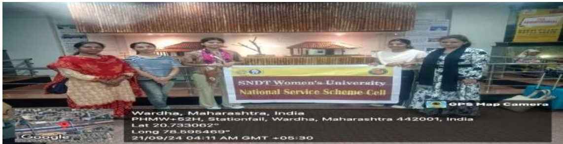
वर्धा येथे भेट देताना एन.एस.एस.विद्यार्थिनी