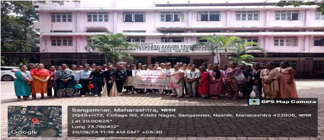
श्रमदानसाठी सज्ज एन.एस.एस. स्वयंसेविका