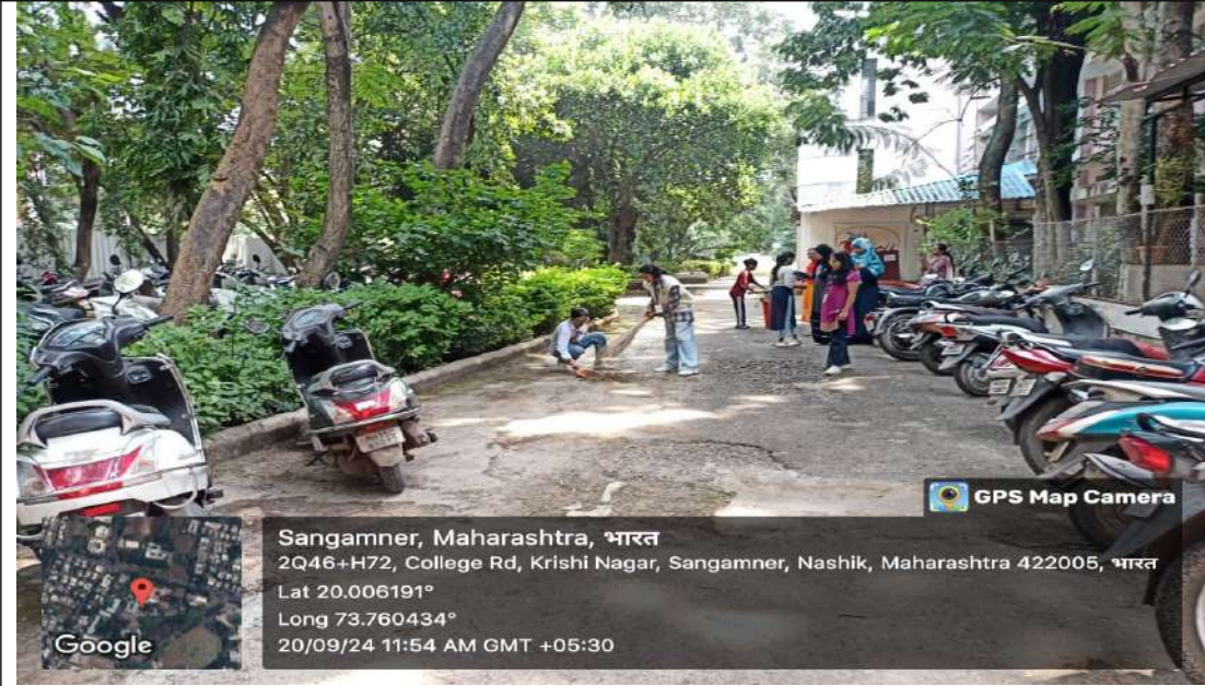
श्रमदान करताना एन.एस.एस.विद्यार्थिनी