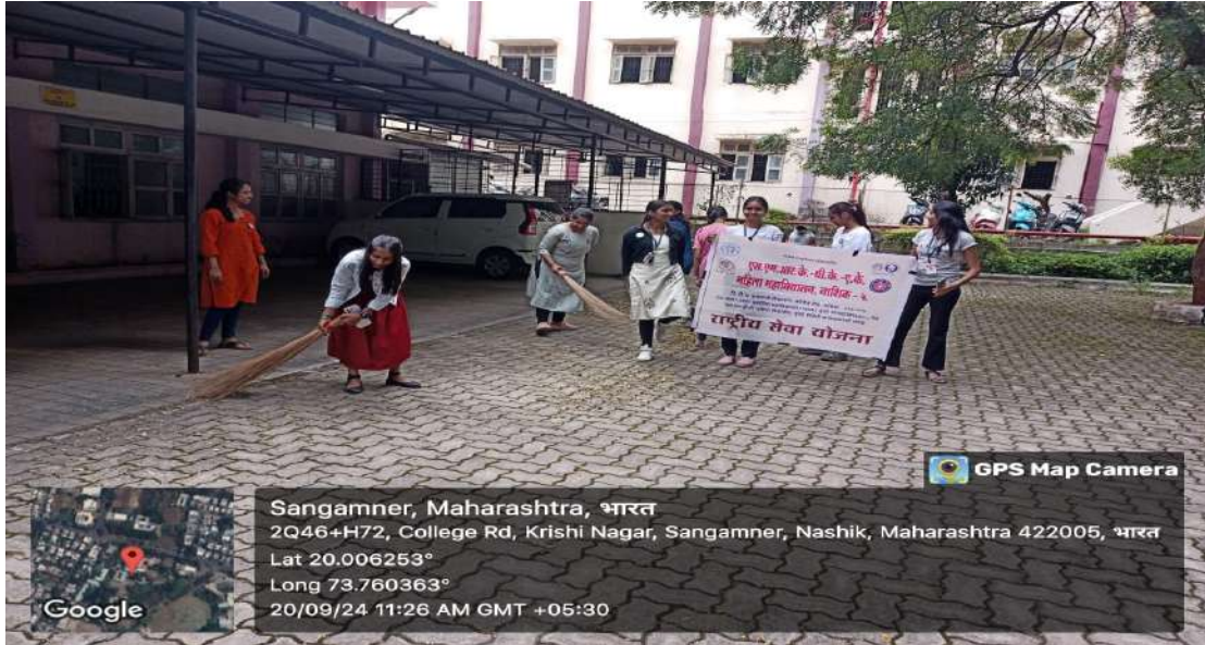
श्रमदान करताना एन.एस.एस.विद्यार्थिनी