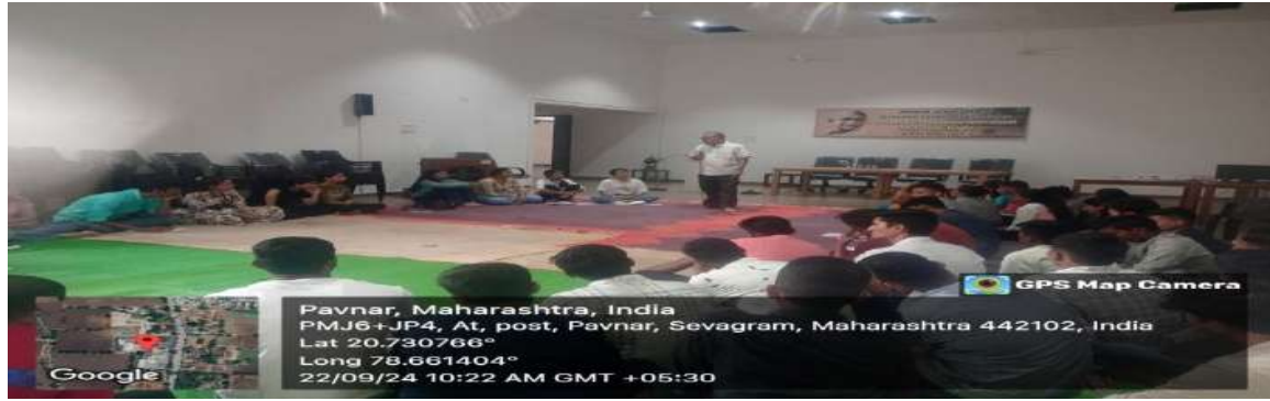
गांधी जीवन-दर्शन ऐकताना एन.एस.एस.विद्यार्थी