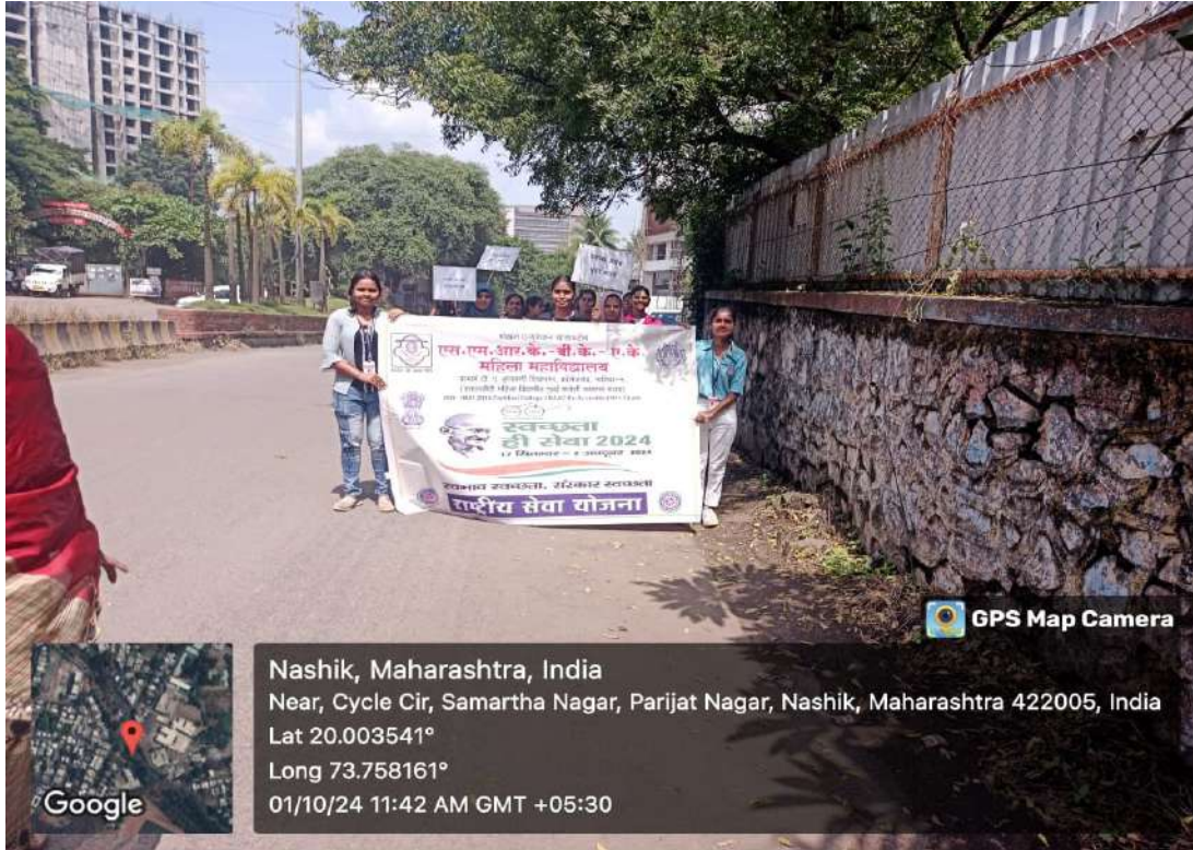
स्वच्छते विषयी रैली करताना एन.एस.एस.विद्यार्थिनी