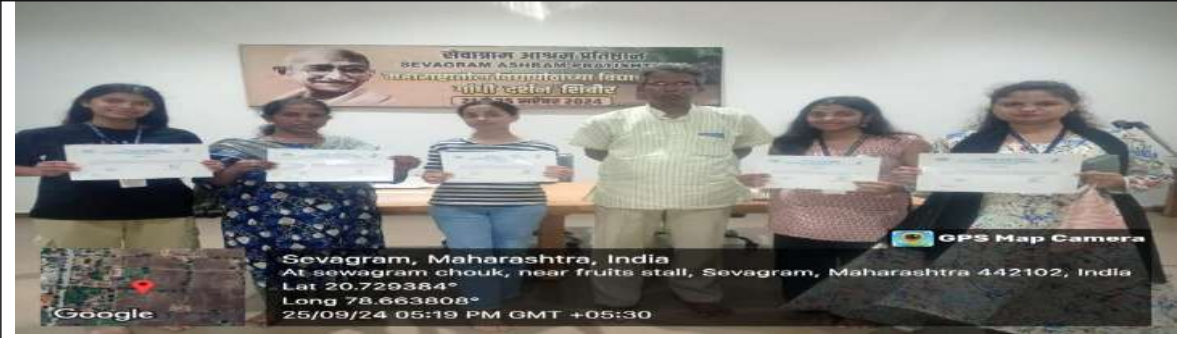
गांधी दर्शन पूर्ण झाल्यावर प्रमाण-पत्र सोबत विद्यार्थिनी