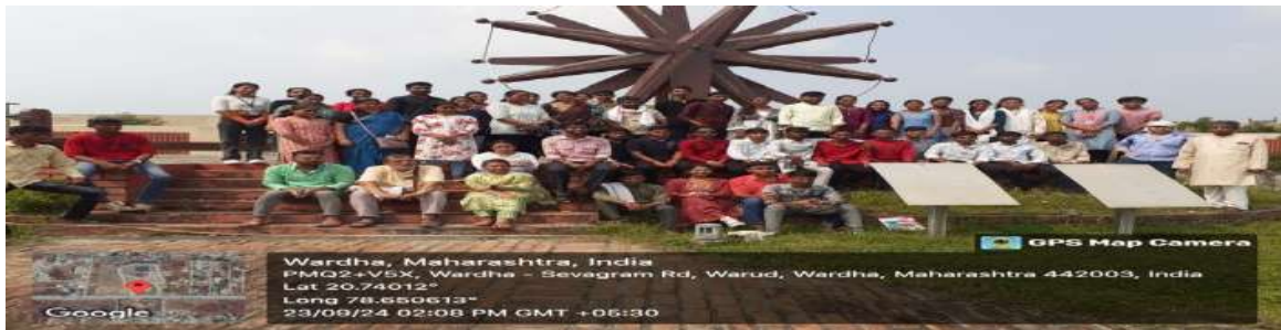
चारखाघर येथे भेट देताना एन.एस.एस.विद्यार्थिनी