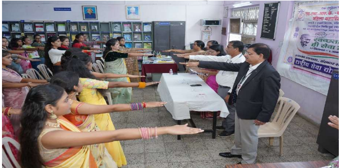
स्वच्छते ची शपथ घेताना एन.एस.एस.विद्यार्थिनी