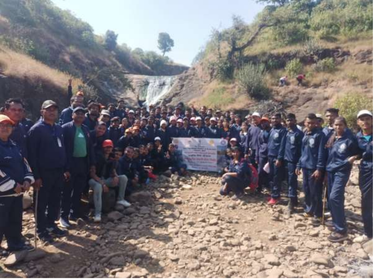
देवी पॉइंट चिखलदार