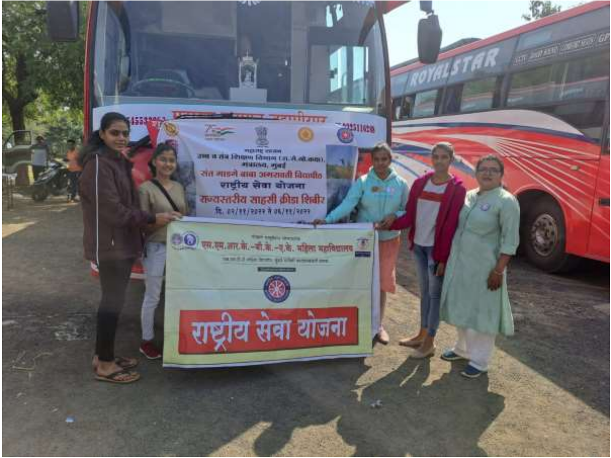
राज्यस्तरीय साहसी शिबिराचा प्रवास सुरु