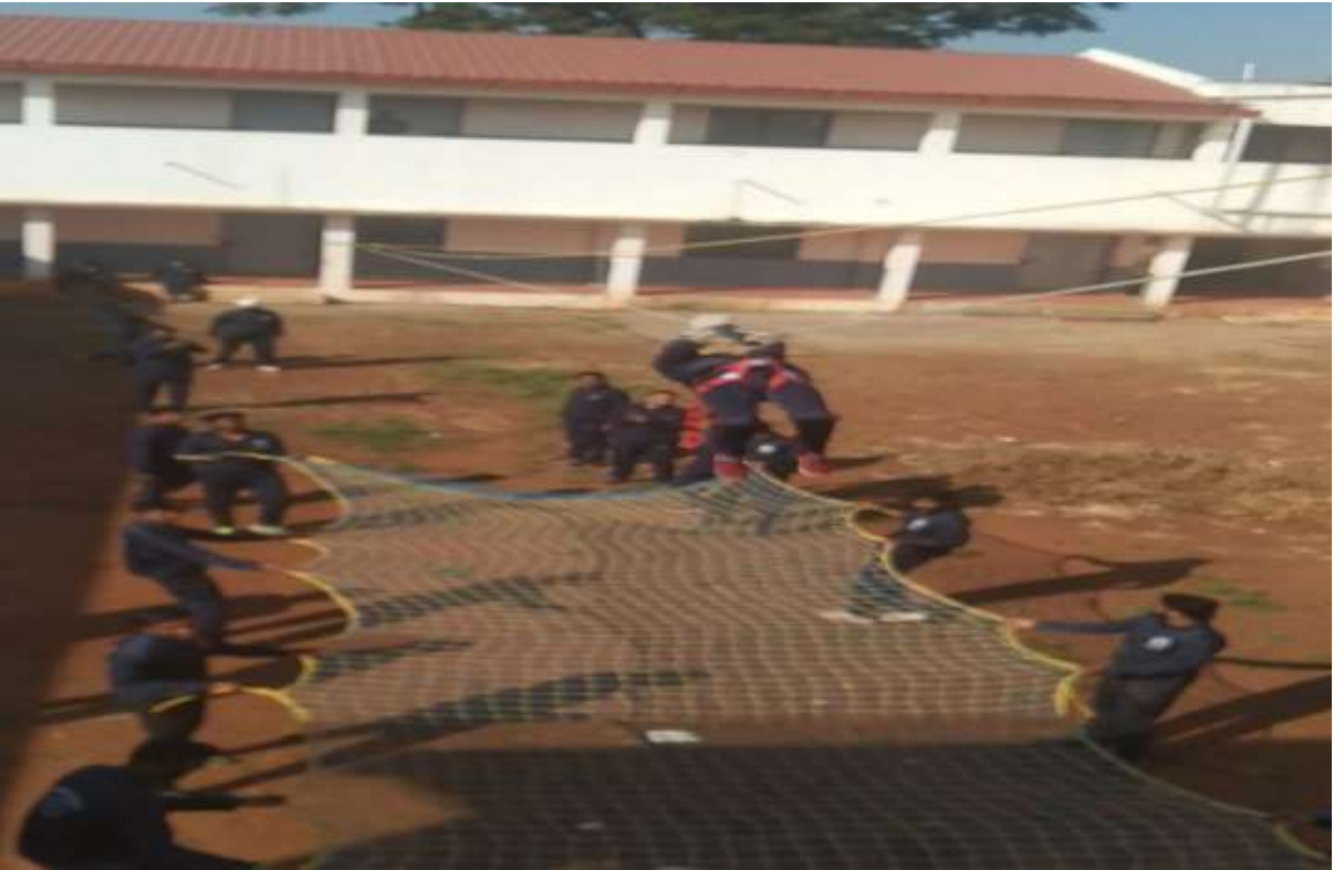
कु.संपदा धोंदे एडवेंचर करताना