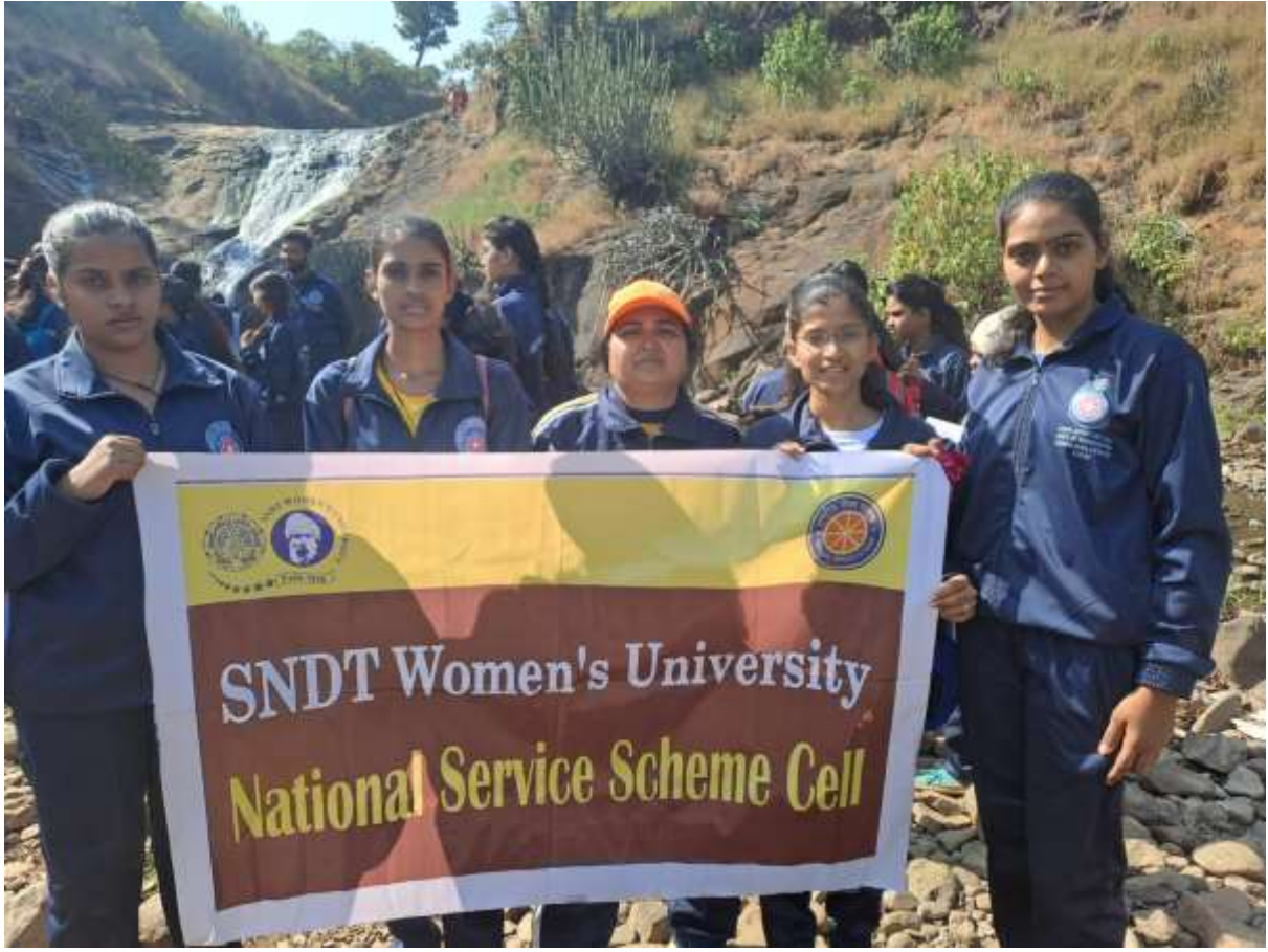
पंचबोला पॉइंट ला जाताना एस.एम.आर.के. नाशिक टीम